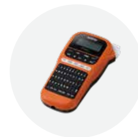
手持式标签打印机