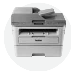
黑白激光多功能一体机