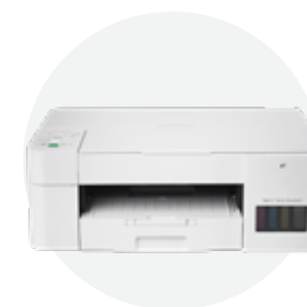
内置墨仓彩色喷墨多功能一体机