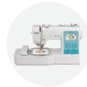
电脑绣花·缝纫一体机