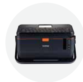
套管 / 标签打印机