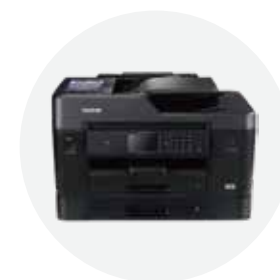
彩色喷墨多功能一体机