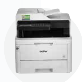
彩色数码多功能一体机