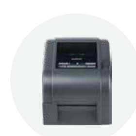
热转印电脑标签打印机