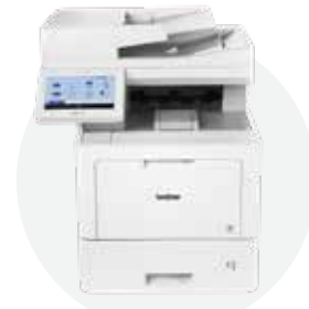
彩色激光多功能一体机